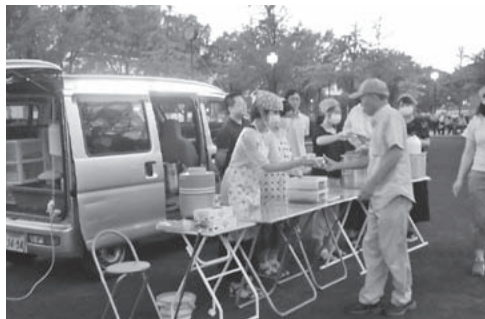
福信館の炊き出し活動をするボランティアの皆さん