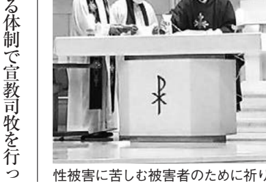
性被害に苦しむ被害者のために祈りとミサを捧げる。

い人、子どもを守るように、と祈った。ミサの終りに岩崎一二三神父により、名古屋教区の決意表明が読まれ、二度と性虐待を起こさない決意をした。