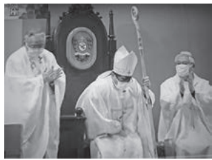
大司教座に着座するペトロ中村倫明大司教。

カトリック長崎大司教区でペトロ中村倫明大司教の着座式が2月23日(水)、浦上司教座聖堂でのミサの中で執り行われた。《写真》 高見大司教様から中村大司教様へ、第10代長崎大司教に就任した。着座式ミサは長崎教区のYoutubeチャンネルで動画をご覧になれます。 https://youtu.be/SWOKNUIH4