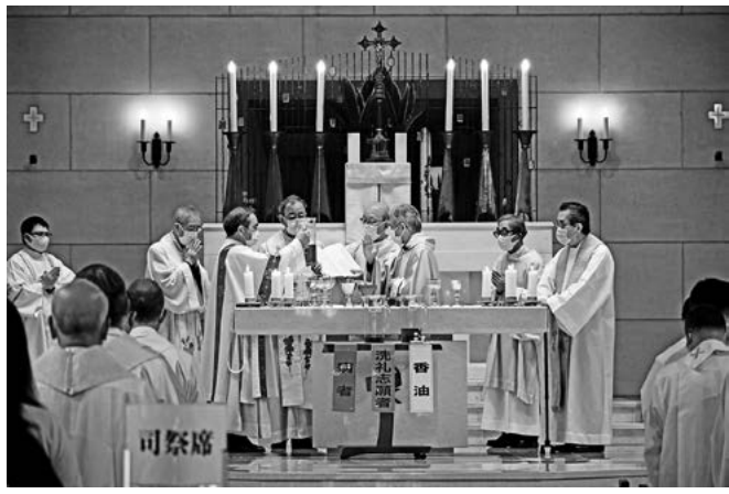
香油の聖別をする松浦司教と司祭団

聖週間の水曜日に名古屋カテドラル布池教会で、松浦司教と名古屋教区各地から集まった司祭たちによる聖香油ミサが4月13日に執り行われた。今年にはコロナ対策として司祭入堂は代表者のみで行われた。