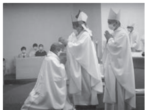
菊地功大司教より授手を受けるエドガル・ガクタン司教