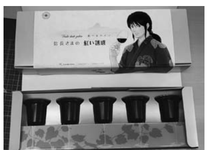
新発売の「食べるワイン」

社会福祉法人AJU自立の家が運営する小牧ワイナリーで働く人々は、障害があっても地域で自立した生活を送ることを目指してワイン造りに励んでいる。ところが昨年に続き新型コロナウイルス感染拡大を受けて、2年連続して売り上げが減少している。 そこで、女性スタッフが中心となって商品化したのが新感覚のゼリー「食べるワイン〜信長さまの紅い誘惑」。甘いお酒が好きな大人の女性をターゲットに、本格的なワインスイーツに仕上がっている。 購入は小牧ワイナリー店頭または公式ホームページのオンラインショップでどうぞ。 〈小牧ワイナリー〉 愛知県小牧市大字野口字大洞2325番2 電話 0568-79-3001/Fax 0568-79-3002 公式HP: https://www.komakiwinery.com/ 営業時間 10:00~16:00 定休日 月曜&第2・4火曜