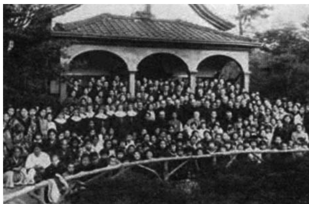
1941年3月6日松岡教区長着座記念