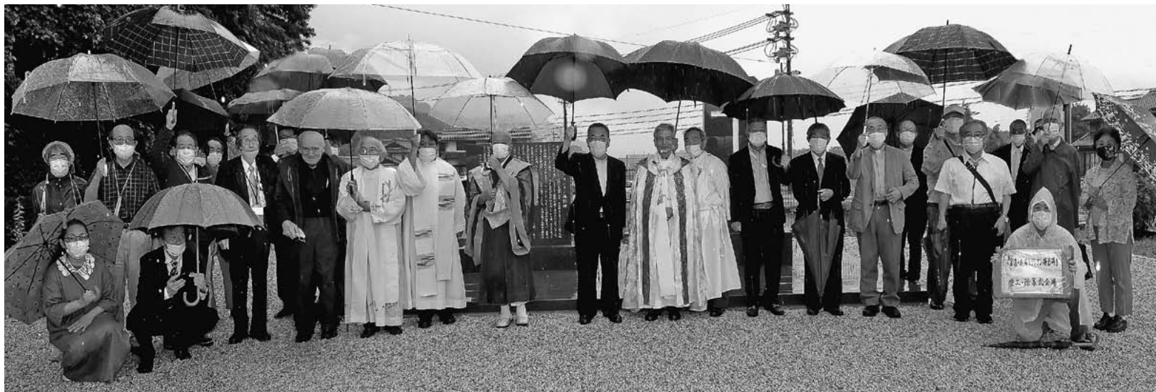
顕彰碑前で記念撮影

参考資料: 「美濃・尾張キリシタン顕彰碑」の所在地は次の通り 所在地 岐阜県可児市塩字宮下22番1 土地面積 660㎡ 問合せ カトリック名古屋教区顕彰委員会 連絡先 ☎052-193512223 e-mail senshiho@nagoya-diocese.jp