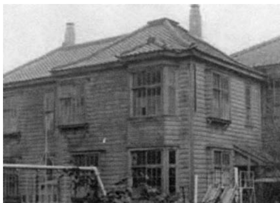
1930年竣工 教区長館(現・司祭館)