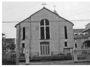
現在のカトリック富山教会

キリシタン迫害後に、滞在して求道者の世話にカトリックの宣教師がふたたび北陸地方を訪れたのは、1880年(明治13)のことであった。ドールワール・ド・レゼー神父が、11月初め、大江伝道士とともに伝道を開始した。北陸地方は、今日でも仏教、特に浄土真宗の教えが浸透した地方であったので、開国してなお日が浅い当時、カトリックの宣教師がこの地方の諸町村で嫌悪され、迫害されたのは当然のことであった。 1888年(明治21)4月、パリ外国宣教会により、それまで岐阜の講義所で伝道士見習いとして数ヶ月間宿泊していた水田若吉が、金沢の片町に日本天主教教会金沢講義所を創設し、北陸におけるカトリック布教が再開された。金沢での布教とは異なり、井上秀齋のような伝道士がその地に